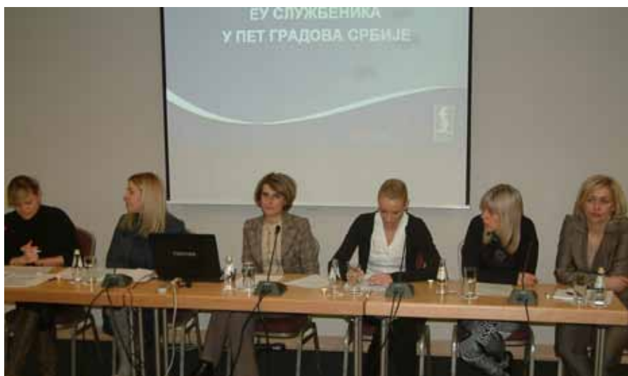
Prezentacija iskustva EU službenica

Veliki broj prisutnih predstavnika lokalne samouprave na finalnoj konferenciji projekta bio je pokazatelj interesa gradova i opština za ovu temu. ■