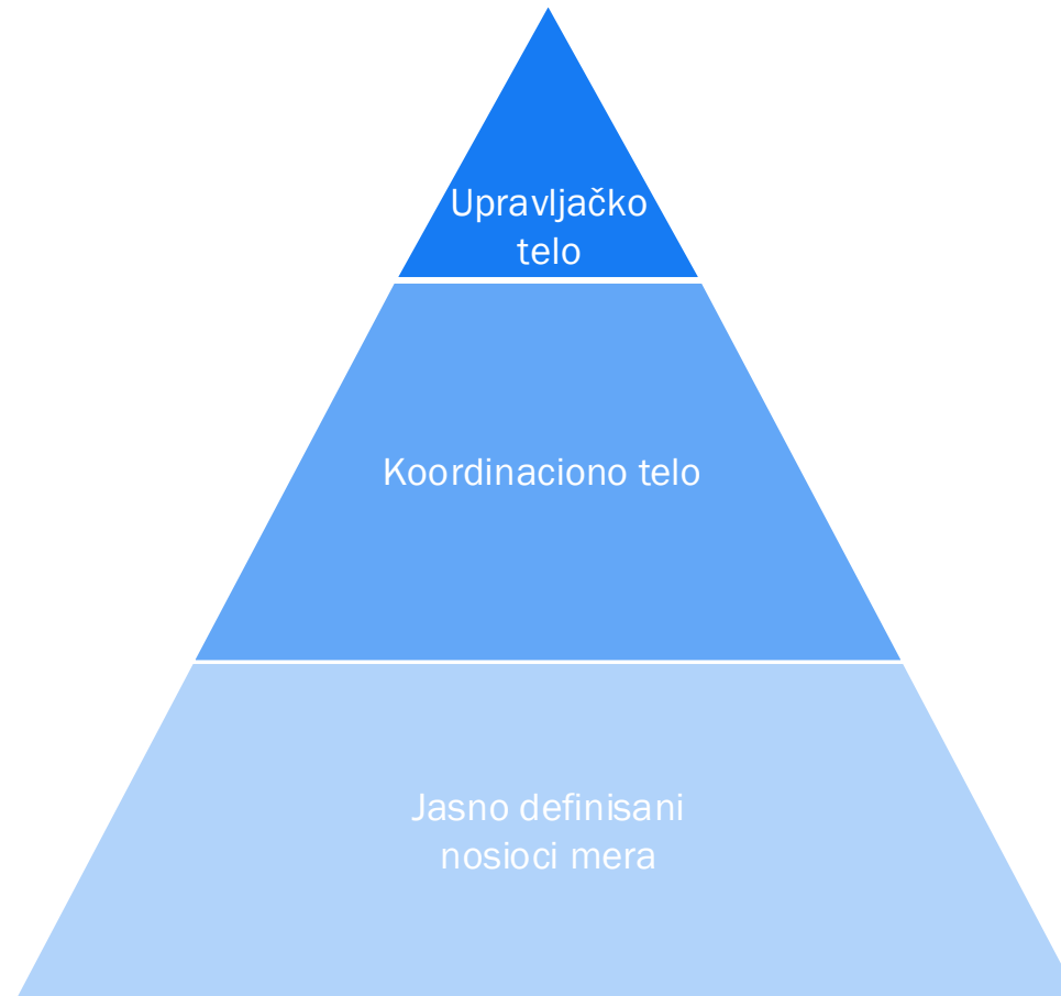
Slika 15: Institucionalni okvir za praćenje