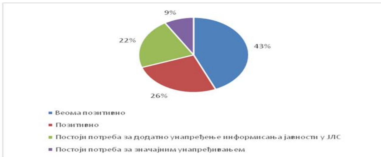
Графикон 13. Самоевалуација ЈЛС у погледу оцене о информисању јавности од стране локалних органа и локалних медија