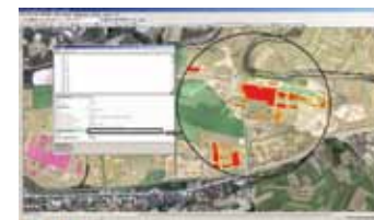
Izgled registra objekata u GIS-u, Direkcija za urbanizam i izgradnju, Kraljevo